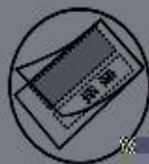
当护卡膜大小不合适时(图A)