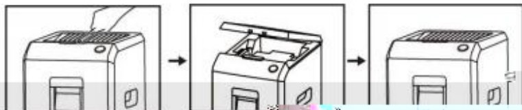
按下红色紧急按钮，关闭