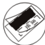
当护卡膜大小不合适时(图A)